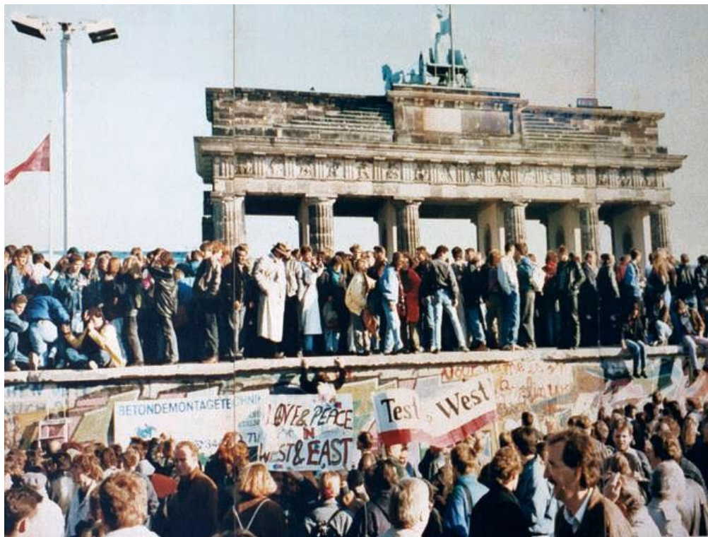
Немецкие жители, забравшиеся на Берлинскую стену. 10 ноября 1989 г.

Начало демократических преобразований в ГДР способствовало активизации идей о единстве Германии. Канцлер ФРГ Г. Коль выступил с программой объединения ФРГ и ГДР. Начались переговоры по этому вопросу, в которых участвовали Великобритания, США, СССР, Франция, ФРГ и ГДР. Первоначально Горбачёв выступал против членства единой Германии в НАТО, однако впоследствии согласился с мыслью, что Германия сама будет вправе решать вопрос об участии в военно-политических блоках. 30 августа 1990 г. в Берлине был подписан договор об объединении ФРГ и ГДР . Объединённая Германия признала все послевоенные границы СССР, Польши и Чехословакии и обязалась не производить на своей территории ядерное, химическое и бактериологическое оружие. 3 октября 1990 г. ГДР перестала существовать, объединившись с ФРГ. Существовавшая всё послевоенное время германская проблема была урегулирована.