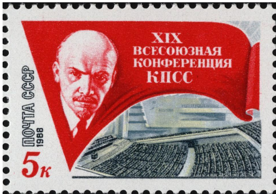
Почтовая марка СССР 1988 г., посвящённая XIX Всесоюзной партийной конференции

В ноябре 1988 г. были приняты законы об изменениях и дополнениях Конституции СССР 1977 г. и о выборах народных депутатов. Согласно новым законам, создававшийся Съезд народных депутатов СССР состоял из 2 250 депутатов. Из состава съезда формировался Верховный Совет СССР, который включал в себя 544 человек. Верховный Совет был постоянно действующим законодательным органом власти. Он состоял из двух палат: Совета Союза и Совета Национальностей. Должность председателя Президиума Верховного Совета упразднилась. Вместо неё вводилась должность председателя Верховного Совета, который избирался на Съезде народных депутатов.