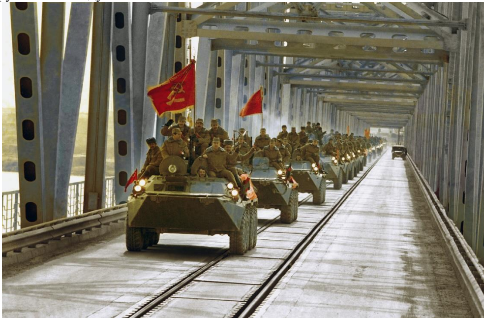
Колонна бронетранспортёров на мосту во время вывода советских войск из Афганистана, 1989 г.

подлежали такому сокращению. Уступки, на которые пошло советское руководство, прекратили гонку вооружений между СССР и США.