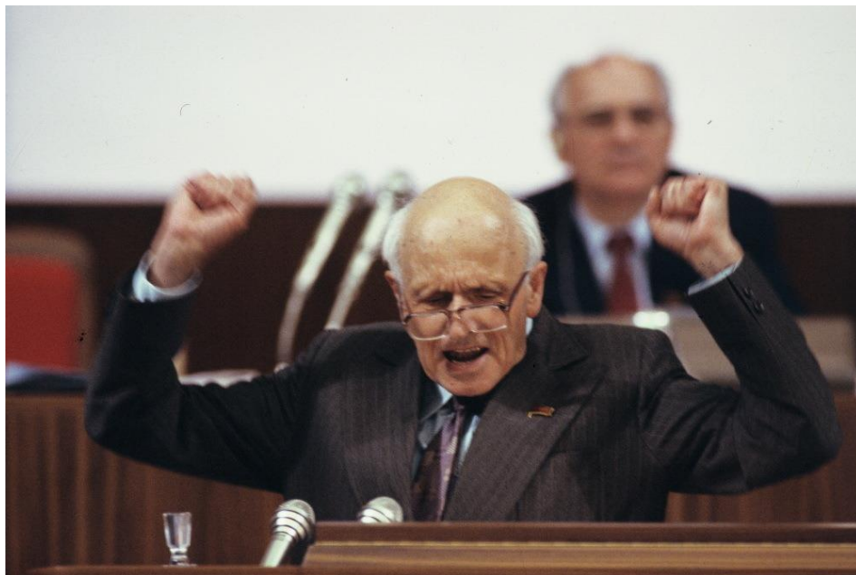
Выступление А. Д. Сахарова на трибуне Съезда народных депутатов СССР, 1989 г.

Съезд народных депутатов — высший орган власти в СССР в 1988–1991 гг.